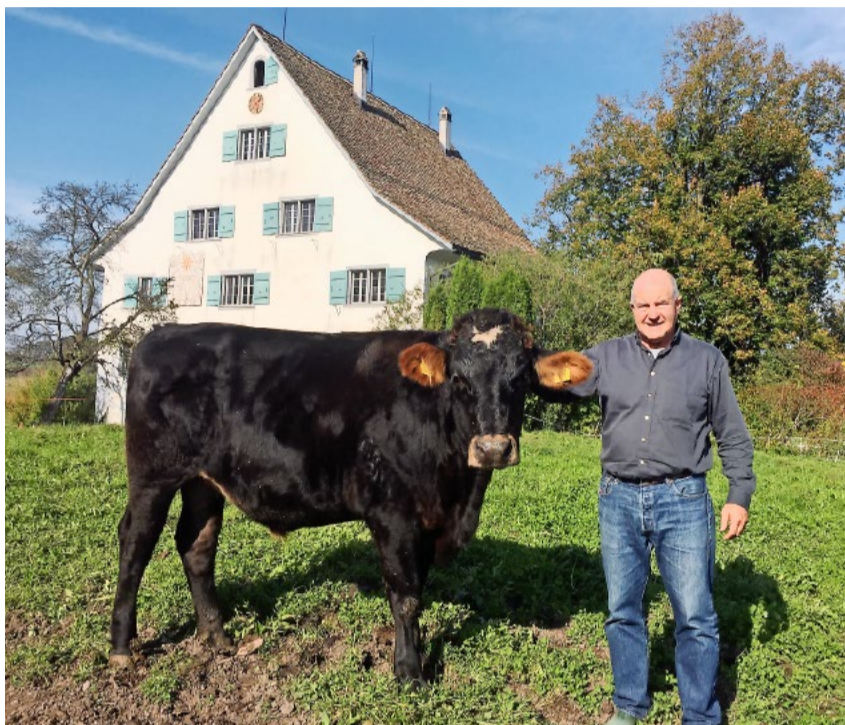
Milchrassen-Ochse Fanjo, 87.5 Prozent BS, 12.5 Prozent HF, Alter 713 Tage, Lebendgewicht (LG) 760kg, Schlachtgewicht (SG) 403 kg, TZW LG 1010gr./Tg, TZW SG 565 gr./Tg, Taxation T4, Ausbeute 53 Prozent. Fütterung: 100 Prozent Vollweide (Kurzrasen), Winter 90 Prozent Gras-Silage, 10 Prozent Heu, kein Mais, kein Kraftfutter.

Die auf den ersten Blick einfache Lösung wäre die vegetarische oder noch konsequenter die vegane Ernährung. Leider löst das die globale Ernährungs-krise nicht. Warum? 500 Mio. der ärmsten Menschen dieser Welt leben direkt und nochmals 500 Mio. indirekt von der extensiven Wiederkäuerhaltung weltweit. Jedes Land oder jede Region auf dieser Welt hat einen adaptierten Wiederkäuer (Rinde, Wasserbüffel, Schaf, Ziege, Yak, Kamel, Neuweltkamelide, Rentier, usw.), welcher meist tief in den Kulturen dieser Völker verankert ist. Oft ist die Nutzung dieser meist extensiven Grasflächen die einzige Existenzgrundlage dieser Völker. Ohne die Tiere in den semiariden, ariden oder Berggebieten dieser Welt wäre eine Existenz nicht möglich. Denken wir nur an die 250 Mio. Rinder in Indien. Ohne die Milch dieser Kühe wäre die Eiweiss-Versorgung der armen Bevölkerung in Indien noch viel schlechter als sie schon